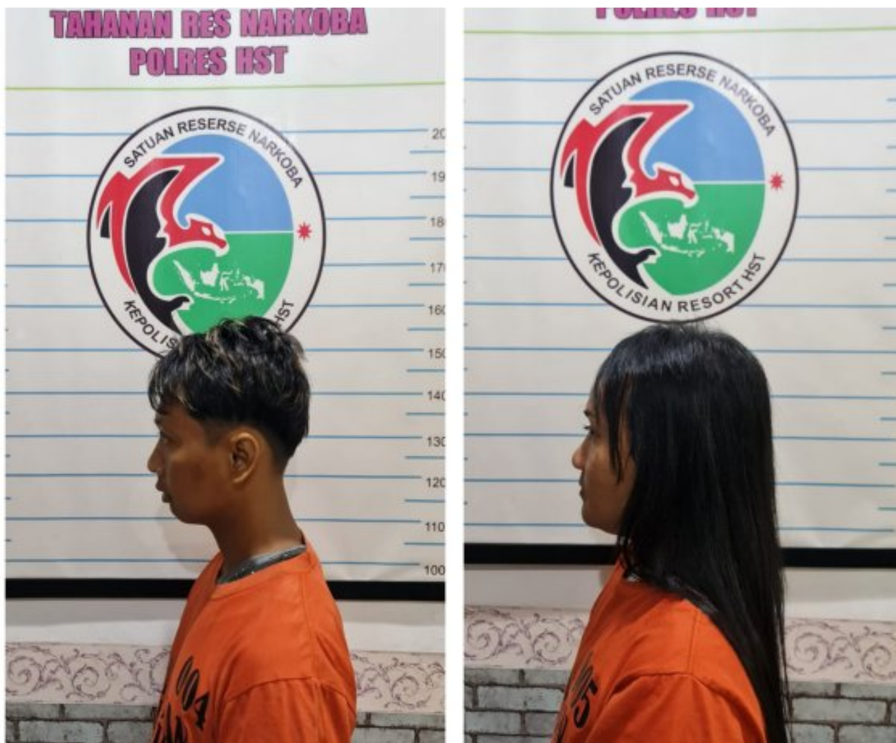
Polres HST Ringkus Dua TSK Penyalahgunaan Narkoba di Dua Tempat Berbeda